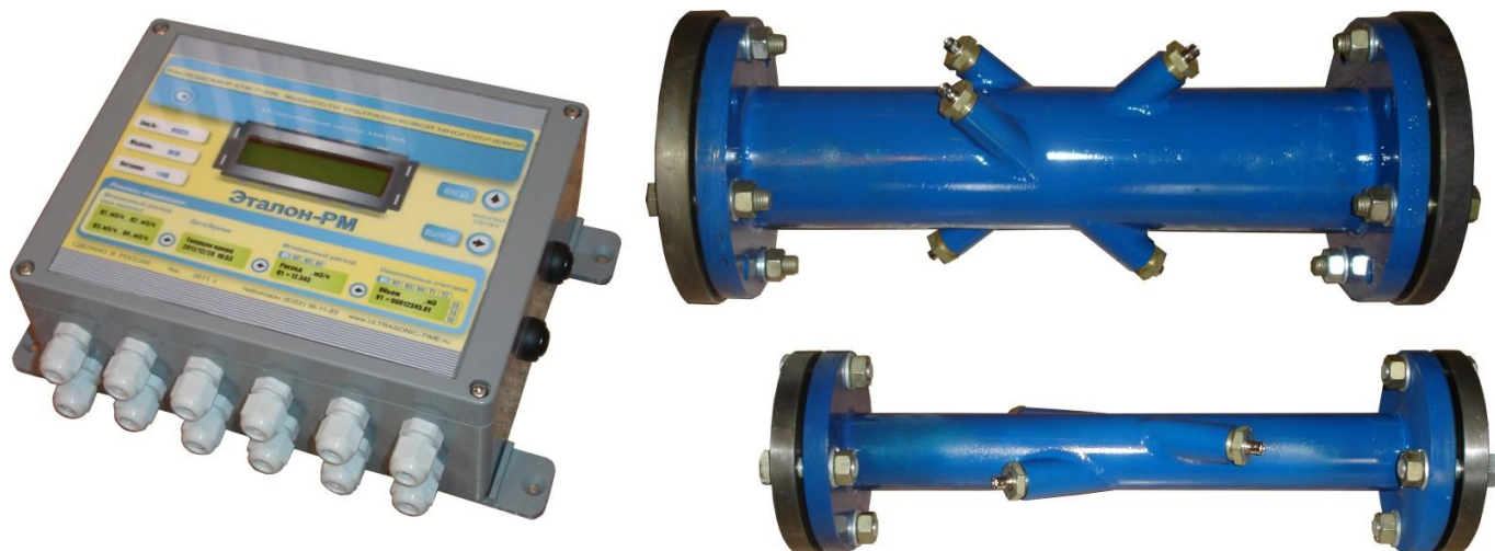
Рисунке 1 – Общий вид расходомеров

Общий вид расходомеров-счетчиков жидкости ультразвуковых многолучевых ЭТАЛОН-PM приведен на рисунке 1: