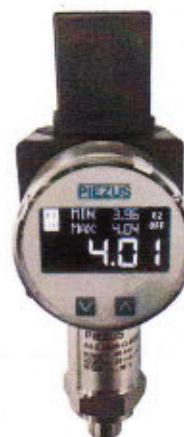
Рисунок 4 - Общий вид датчиков давления тензорезистивных ASZ