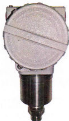
Рисунок 3 - Общий вид датчиков давления тензорезистивных AMZ